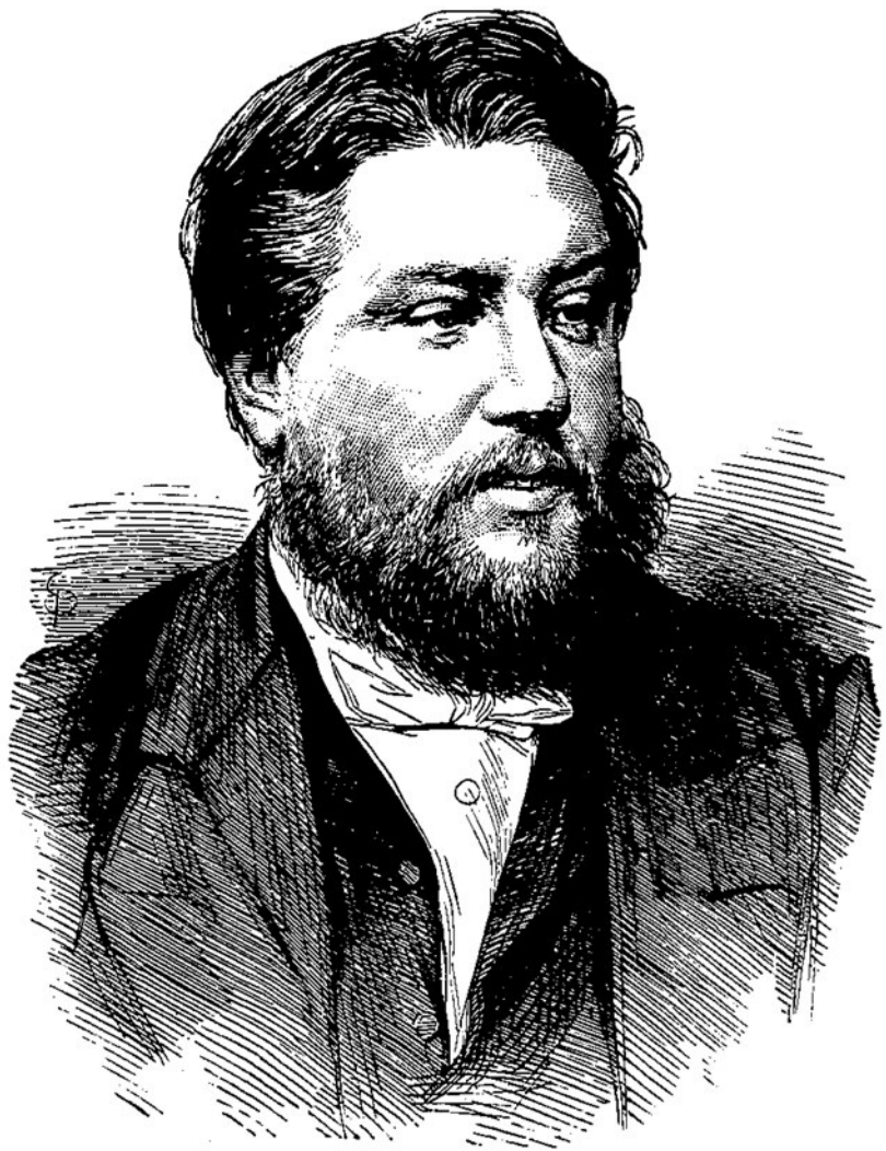
C. H. Spurgeon (1834–1892)